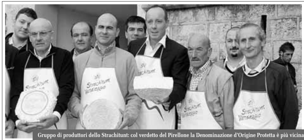
Gruppo di produttori dello Strachitunt: col verdetto del Pirellone la Denominazione d'Origine Protetta è più vicina