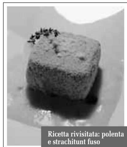
Ricetta rivisitata: polenta e strachitunt fuso