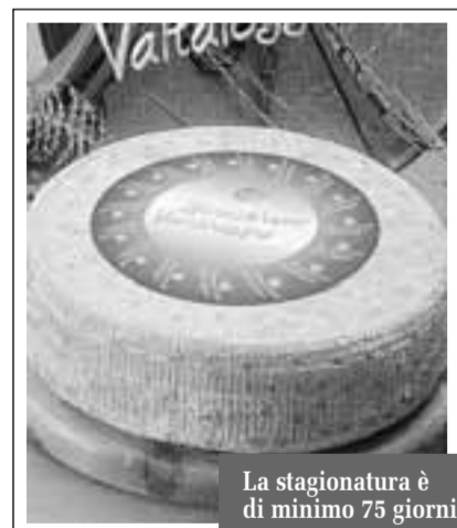
La stagionatura è di minimo 75 giorni